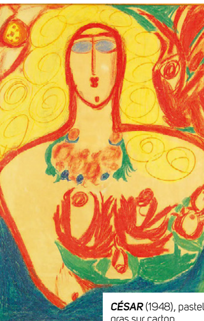
CÉSAR (1948), pastel gras sur carton.

Très beau catalogue chez Photosynthèses et Jeu de paume, 45 €.